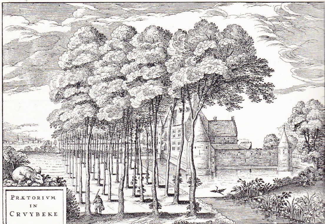
D'après A. Sanderus, 1641